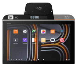
Sunmi D3 MINI