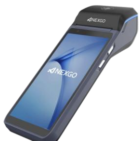
Uređaj NEXGO P200