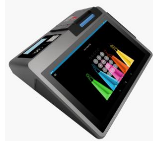
ENU eFiskal Z100

**Uređaj se kupuje u okviru 24 mjesečne pretplate.