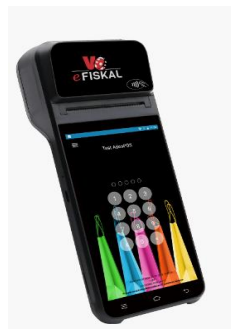
ENU eFiskal Z91 Pro

**Uređaj se kupuje u okviru 24 mjesečne pretplate.